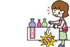
買い物中過ぎて商品を壊した