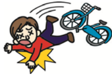
自転車で転んでのケガ