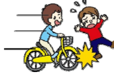
自転車にはねられてのケガ