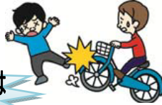
自転車で通行人にけがをさせた