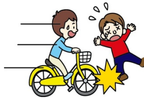
自転車にはねられてのケガ