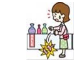
買い物中過って商品を壊した