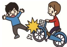
自転車で通行人にケガをさせた