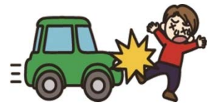
自動車にはねられてのケガ