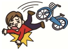
自転車で転んでのケガ