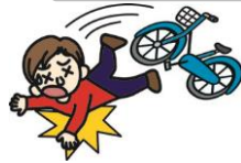
自転車で転んでのケガ