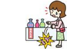
買い物中過って商品を壊した