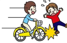
自転車にはねられてのケガ