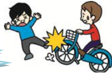
自転車で通行人にけがをさせた