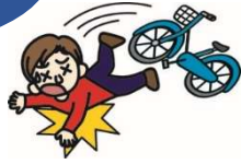
自転車で転んでのケガ