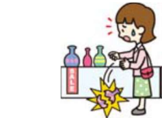
買い物中過って商品を壊した