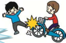
自転車で通行人にけがをさせた