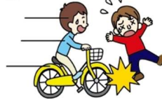
自転車にはねられてのケガ